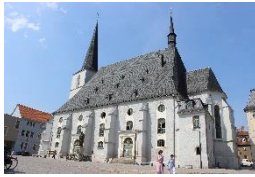
Kirche St. Peter & Paul Weimar