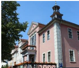
Rathaus Bad Berka