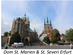
Dom St. Marien & St. Severi Erfurt