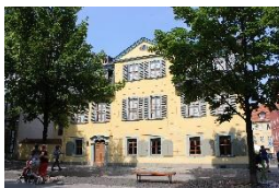
Schillers Wohnhaus Weimar