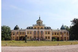
Schloss Belvedere Weimar