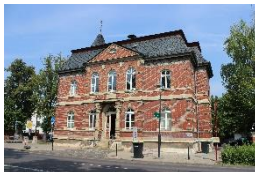
Ehemaliges Rathaus Vieselbach