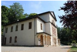
Coudray Haus Bad Berka