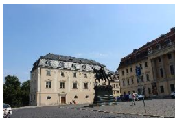
Anna Amalia Bibliothek Weimar