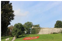
Zitadelle Petersberg Erfurt