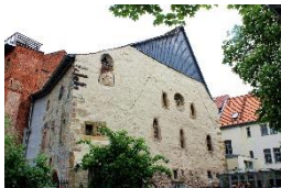
Alte Synagoge Erfurt