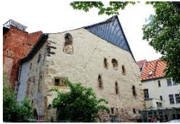
Alte Synagoge Erfurt