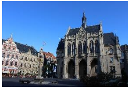
Rathaus & Fischmarkt Erfurt