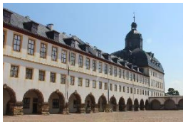
Schloss Friedenstein Gotha