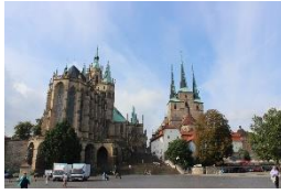
Dom St. Marien & St. Severi Erfurt