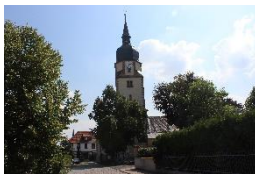
Pfarrk. St. Walpurgis Apfelstädt