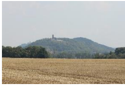
Burgruine Gleichen Wandersleben