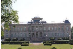
Herzogliches Museum Gotha