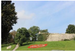
Zitadelle Petersberg Erfurt