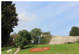
Zitadelle Petersberg Erfurt