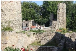
Schlossruine Neideck Arnstadt