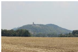
Burgruine Gleichen Wandersleben