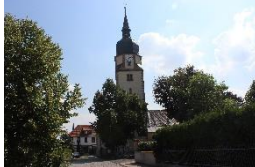
Pfarrk. St. Walpurgis Apfelstädt