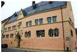
Alte Universität Erfurt

immer entlang der Gera, vorbei an Walschleben, Elxleben und Kühnhausen durch Gispersleben wieder zurück in das Zentrum der Landeshauptstadt Thüringens.