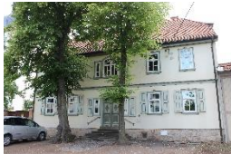
Histor. Pfarrhaus Stotternheim