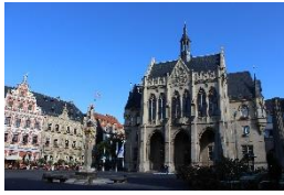
Rathaus & Fischmarkt Erfurt