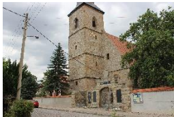
St. Michaelis-Kirche Elxleben