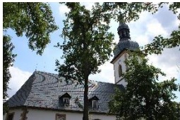
St. Peter & Paul-Kl. Stotternheim