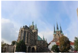
Dom St. Marien & St. Severi Erfurt