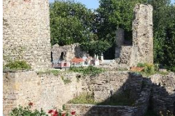
Schlossruine Neideck Arnstadt