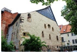
Alte Synagoge Erfurt