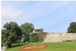
Zitadelle Petersberg Erfurt