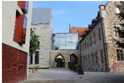
Evang. Augustinerkloster Erfurt