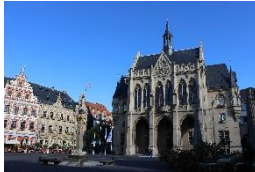
Rathaus & Fischmarkt Erfurt

entlang der Wegweiser, vorbei an Hausen nach Angelhausen-Oberndorf. Die Straße Am Vorwerk leitet Sie in den Ort. Biegen Sie zwei Mal rechts, zunächst auf die Burggasse und anschließend auf die Angelhäuser Straße, ab. Diese führt Sie in das Stadtzentrum von Arnstadt. Folgen Sie hier der Stadtilmer Straße entlang der Wegweiser des Geraradweges. Sie gelangen nach Ichnershausen. Beachten Sie am Ortsausgang bitte die Hinweise oder eventuelle Umleitungen des Geraradweges nach Molsdorf. Vorbei am Schloss Molsdorf führen Sie die Wegweiser durch Möbisburg, Bischleben und Hochheim zurück in das Altstadtzentrum von Thüringens Landeshauptstadt Erfurt.