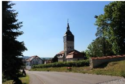
St. Peter & Paul-K. Niederwilligen