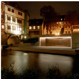
Mittelalterliche Mikwe in Erfurt