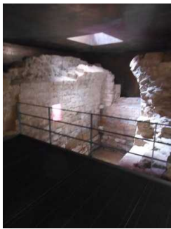
Besichtigungsebene der Mikwe