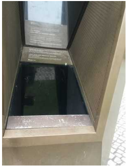
Schaufenster in die Mikwe