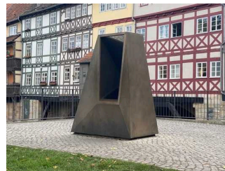
Plateau mit Schaufenster in die Mikwe