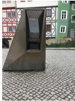
Schaufenster in die Mikwe