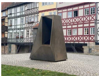
Plateau mit Schaufenster in die Mikwe