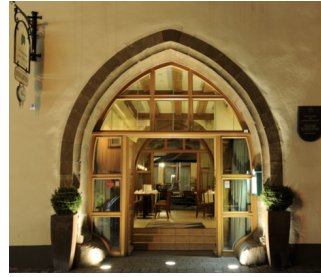
Stufen zum Restaurant

Anmerkungen für den Gast: Zugang zum Restaurant über 3 Stufen, alternativ ist ein stufenloser Zugang über das Hotel möglich.