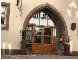
Eingang zum Restaurant