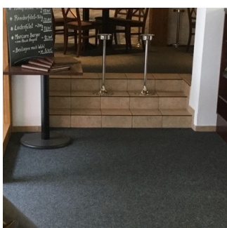
3 Stufen zum Restaurant / Separee