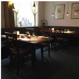
Blick ins Restaurant