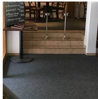
Stufen im Restaurant

Es gibt Tische mit heller und blendfreier Beleuchtung.