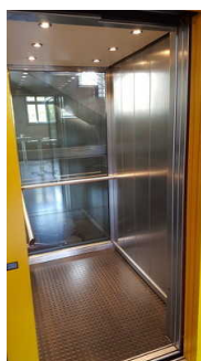
Aufzug Haus 2

Über den Aufzug sind zu erreichen: Zimmer 20 , Tagungsraum Bonifatius Haus 2 , Weg im Haus 2 zu Zimmern und Tagungsräumen