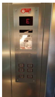
Bedienfeld im Aufzug Haus 2