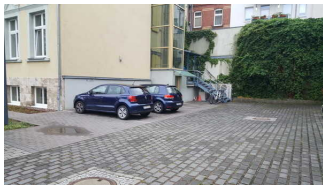
Parkplatz im Innenhof

Über den Weg sind zu erreichen: Haus 1 Eingang im Hof mit Parkplatz