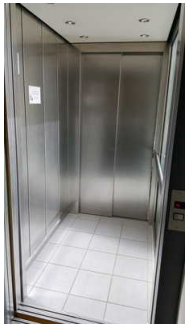
Aufzug Haus 1

Die Bedienelemente bzw. die Beschilderung sind weder bildhaft noch (im Falle eines entsprechenden Leitsystems) farblich gekennzeichnet.