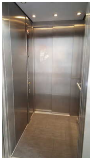
Aufzug zum Speisesaal

Die Bedienelemente bzw. die Beschilderung sind weder bildhaft noch (im Falle eines entsprechenden Leitsystems) farblich gekennzeichnet.