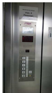
Bedienfeld im Aufzug Haus 1