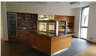
Buffet im Speisesaal