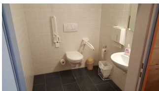
WC im Haus 2

Die Toilette gehört zu: Tagungsraum Saal Haus 2 , Tagungsraum Bonifatius Haus 2