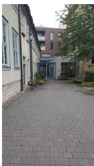
Weg zum Haus 2

Über den Weg sind zu erreichen: Haus 2 Hofeingang