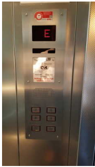
Bedienfeld im Aufzug Haus 2

Die Bedienelemente bzw. die Beschilderung sind weder bildhaft noch (im Falle eines entsprechenden Leitsystems) farblich gekennzeichnet.