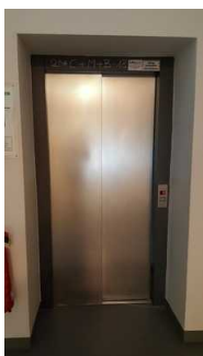
Aufzug Haus 1