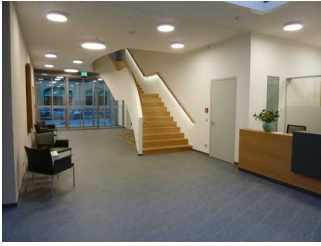
Eingangsbereich und Rezeption