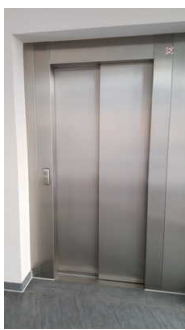
Aufzug zum Speisesaal