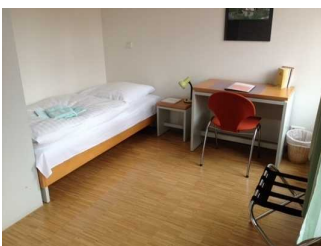
Bett im Zimmer 20