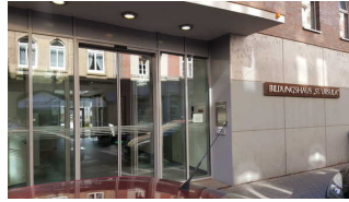
Haupteingang mit Logo

Name und Logo des Betriebes/der Einrichtung sind von außen klar erkennbar.