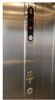
Bedienfeld im Aufzug zum Speisesaal