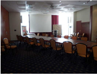
Blick in den Raum Wartburg

Sanitärraum vorhanden: Behinderten-WC Untergeschoss