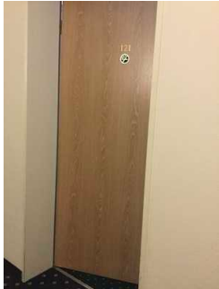
Tür zum Zimmer mit Beschilderung