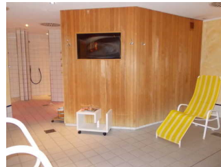
Ruhebereich vor Sauna