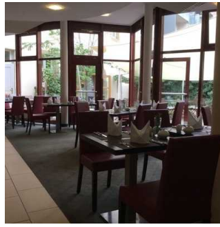
Blick in das Restaurant