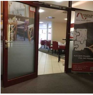
Tür zum Frühstücksraum / Restaurant