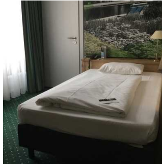
Blick aufs Bett