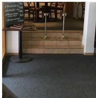
Zum Separee mit 4 Tischen über 3 Stufen

Es gibt Tische mit heller und blendfreier Beleuchtung.