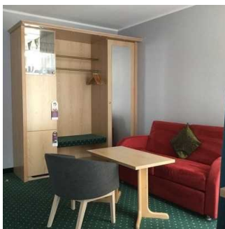
Blick auf die Sitzgruppe und Schrank