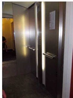
Blick in den Aufzug

Über den Aufzug sind zu erreichen: Schlafraum Zimmer 121 , Weg von der Rezeption zum Zimmer