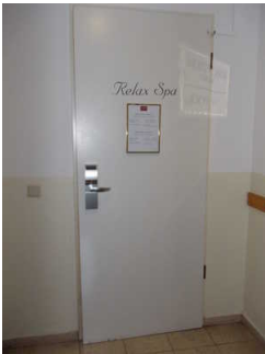
Tür zum Saunabereich