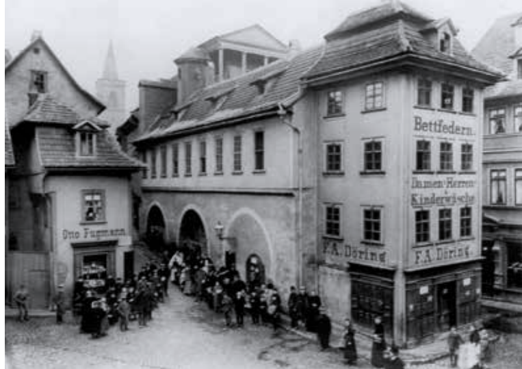
▲ Eingang zur Krämerbrücke vom Benediktsplatz

» in den Pfeilern entstehen Kellergewölbe