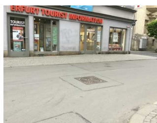
Weg im Außenbereich