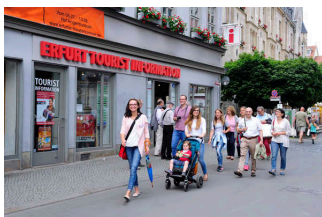
Führungen in Erfurt erleben

Die Gästeführer sind so ausgebildet, dass Menschen mit kognitiven Beeinträchtigungen an jeder Führung teilnehmen können.