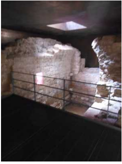
Besichtigungsebene der Mikwe

Anmerkungen für den Gast: Die Mikwe kann nur im Rahmen einer Führung besichtigt werden. Die Tür zur Mikwe wird vom Servicpersonal geöffnet. Die Besichtigungsebene im Inneren ist 320 breit und 380 cm lang.