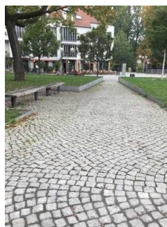
Weg zum Plateau

Über den Weg sind zu erreichen: Eingangsbereich , Plateau mit Schaufenster in die Mikwe