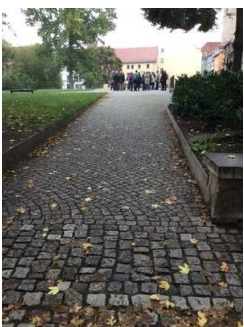
Weg außen zur Mikwe und Plateau