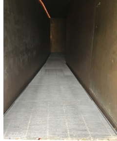
Durchgang zur Mikwe über Gitterrost