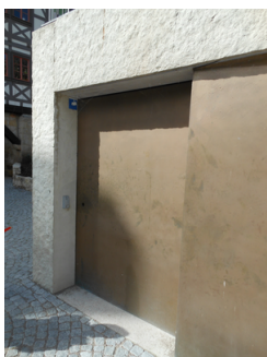
Eingangstür der Mikwe

Name und Logo des Betriebes/der Einrichtung sind von außen klar erkennbar.