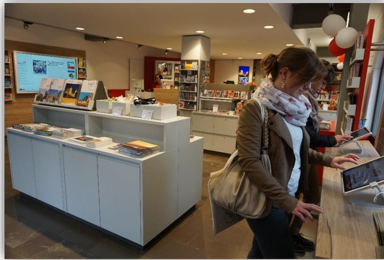
Erfurt Tourist Information / Erfurt Tourismus & Marketing