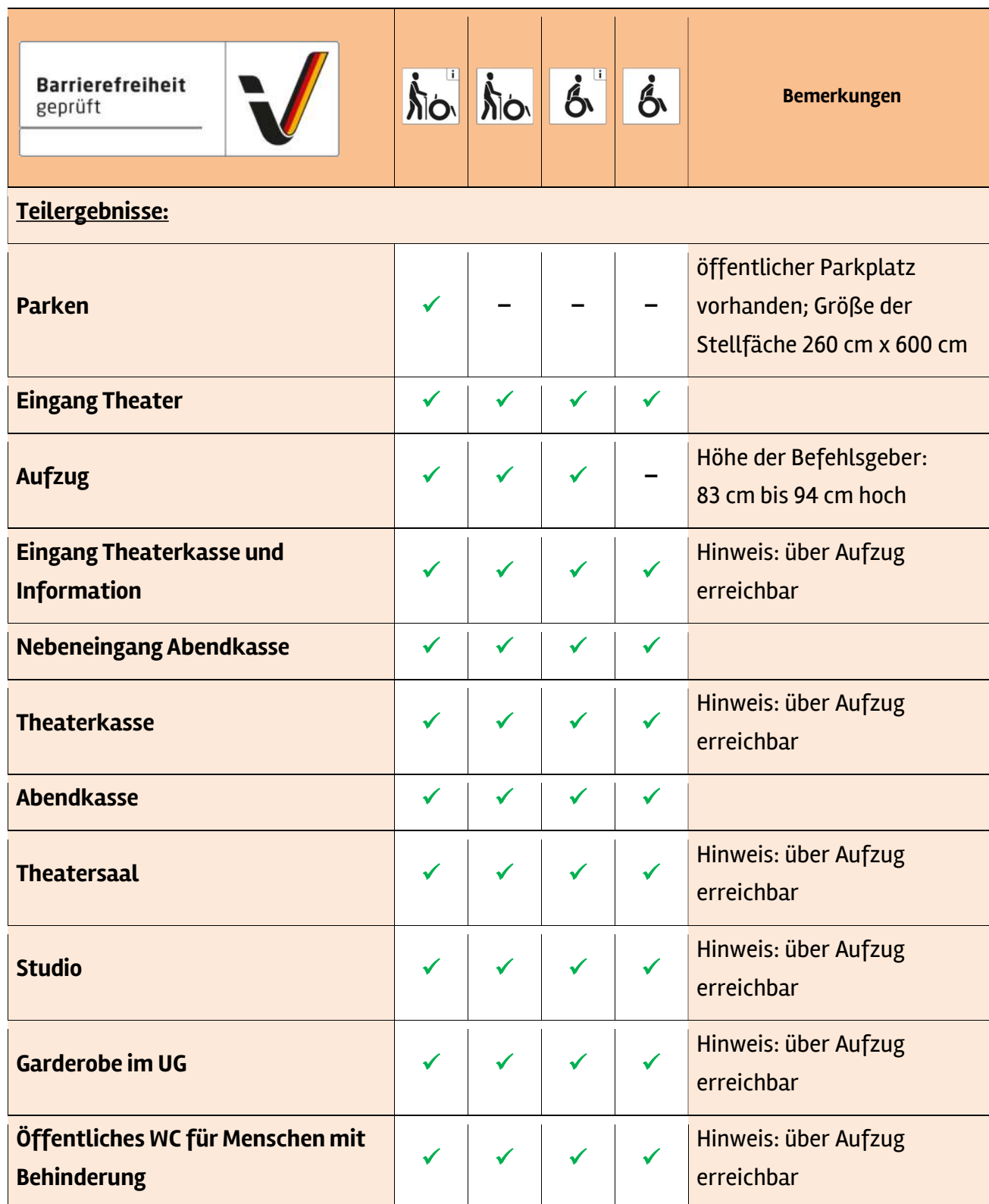
Tabelle 1: Überblick über das Prüfergebnis